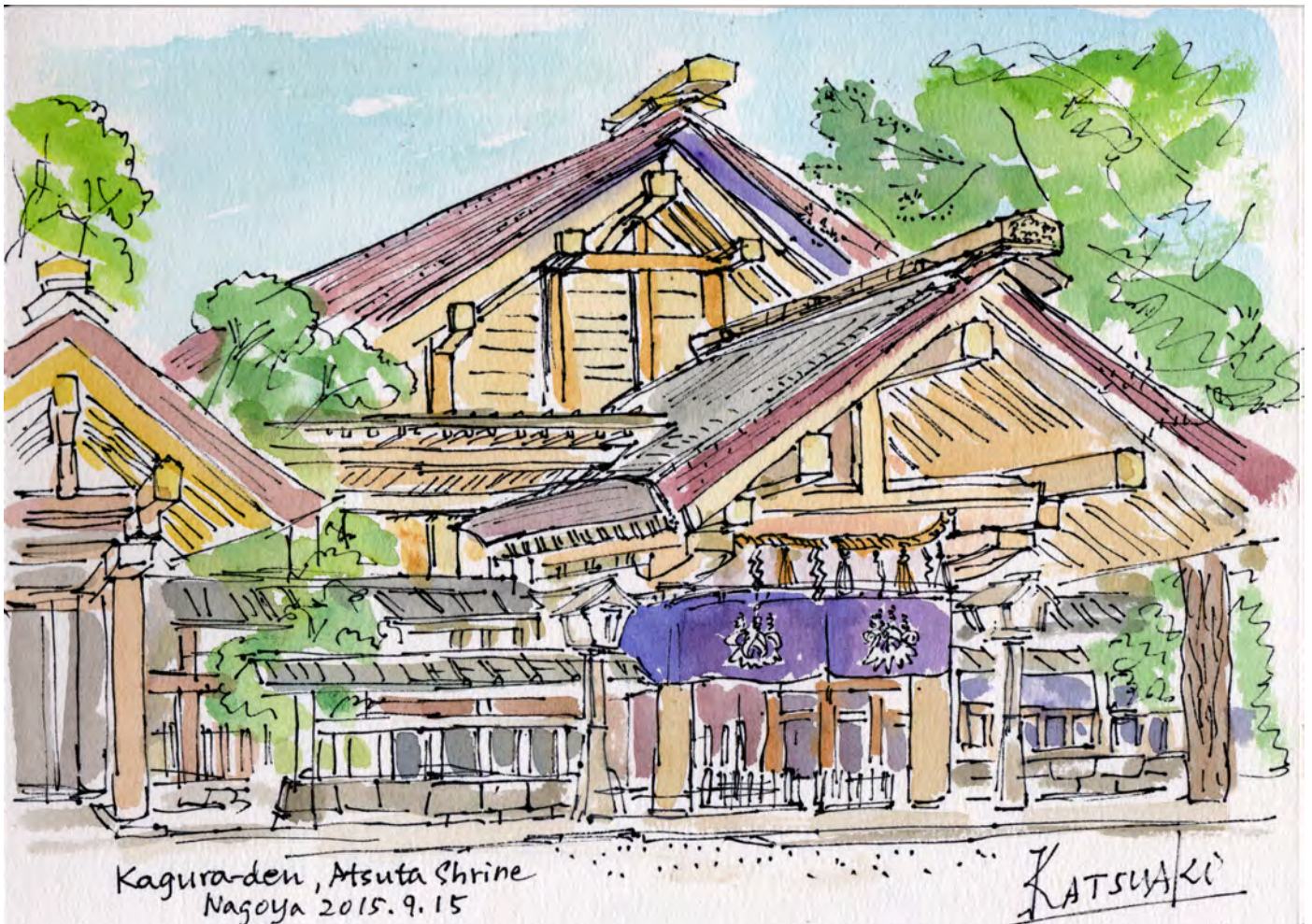
Kagura-den, Atsuta Shrine Nagoya 2015.9.15