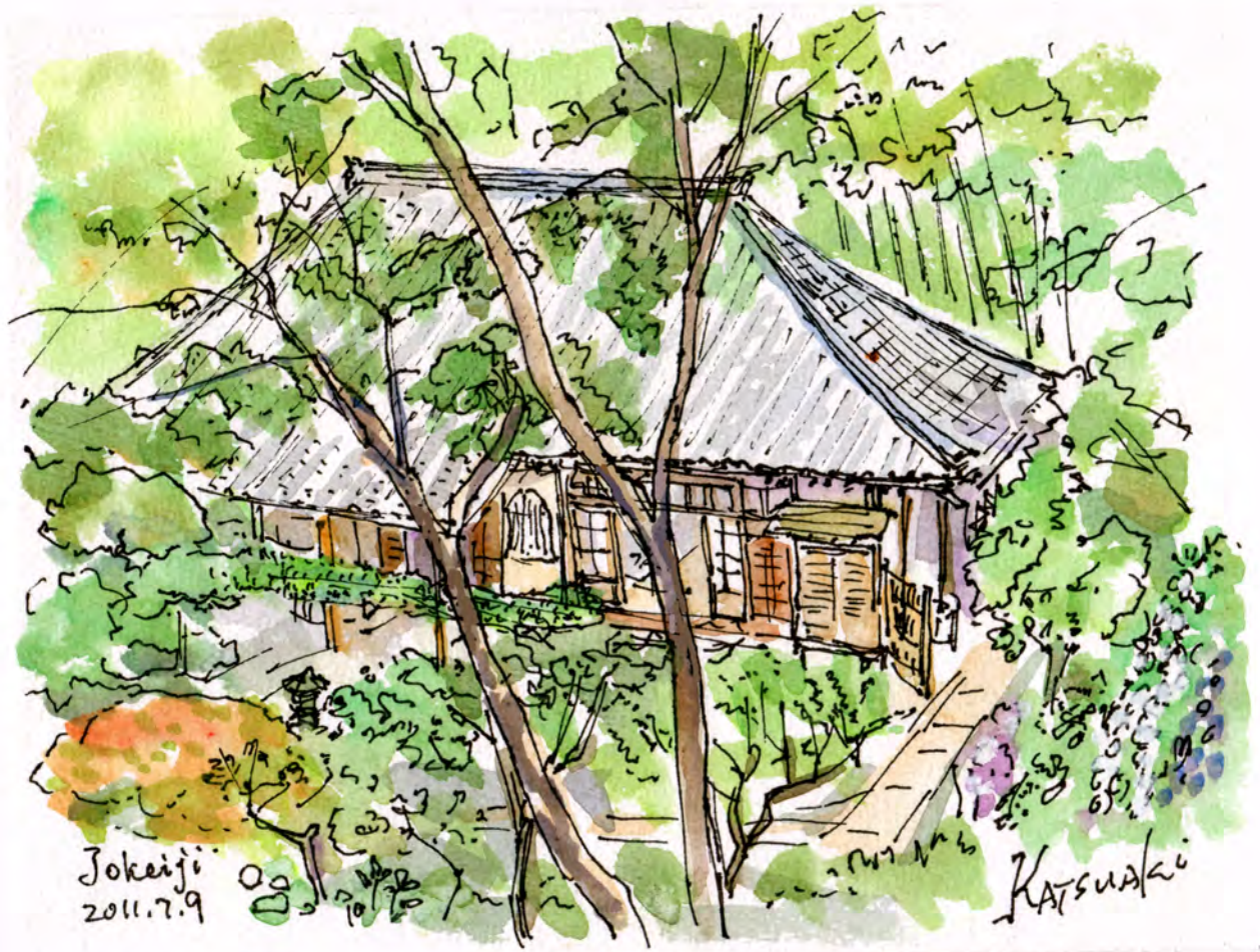
浄慶寺 (柿生の紫陽花寺)