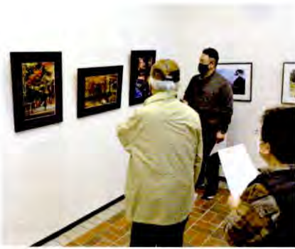
第8回あさお写遊会

今年にはメンバーの一人が長期療養となり、急遽40代の若手にピンチヒッターを依頼。作品を並べてみると経験の差はあるものの、撮影技術や対象をとらえる感性には、学ぶものもありました。熟年世代の我々としては、若手と関わることで刺激をもらいつつ、さらにレベルアップした作品を皆様にご覧いただきたいと思えます。