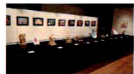
写真・工芸・彫刻展示