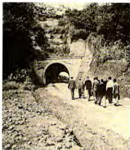
開通のころ（上麻生側） 柿生トンネル （「ふるさとを語る」より）

いのは写真だけ。見掛けたらそーっとしておきましょう。その昔、薪炭林だった頃のコナラが今では大径木となり、ナラ枯れに遭っています。現場では試行錯誤が続きます。定例活動日、環境学習などの日はどうぞお出かけください。皆様のお知恵とご助力をよろしくお願ひします。