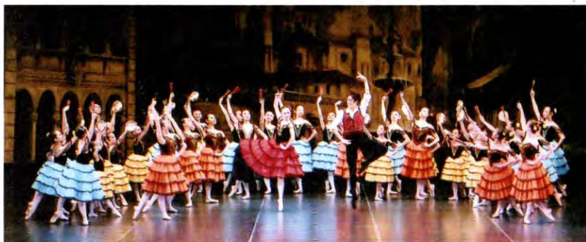
クラシックバレエ ドン・キホーテより「ヴァルセロナの広場」(胡桃バレエスタジオ・Hagaバレエアカデミー競演)

りました。それぞれ特徴のある各文化協会の意見をまとめることが簡単ではない中、今後も大きな課題である予算の不足や感染対策に苦慮しつつ準備が進み、直前の本番リハーサルもマスク付きにするや否や論議、模索の上ようやく当日を迎えました。開催が実現できたことに加え無事終了できましたこと、携わった方々のご尽力に厚く御礼申し上げます。