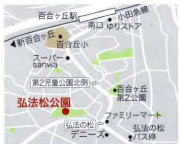
(写真と文／山本 彬夫)

弘法の松公園は、多摩丘陵でも相当高い地点に立地しています。そのため周辺の街並みのほか、晴天の日には遠くの富士山や、大山などの丹沢山系の山々、さらには南アルプスまで眺めることができます。あまり宣伝などがされていないため、地元の人々以外は訪れることのない穴場の公園と言えるでしょう。