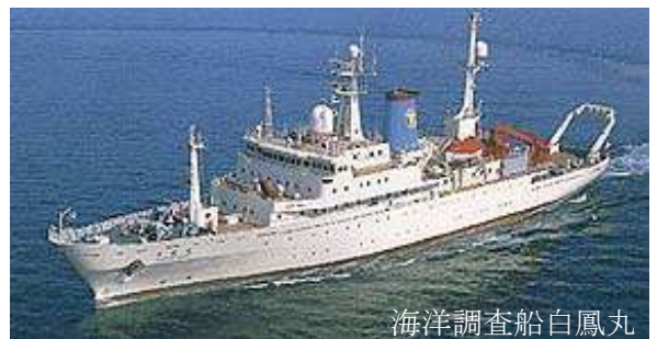
海洋調査船白鳳丸

小池： 現在海洋生物計測は、センサーが律速しています。物理情報、たとえば、温度、塩分、流れ (ADCP : Acoustic Doppler Current Profiler) は測定できています。センサの寿命が問題ですが、溶存酸素濃度、PH は OK ですが、栄養塩は感度がないので無理です。CO は表面ではできていますが、海水の中では、濃度的に無理です。要は、海水を採ってきて、研究室で測定すれば、(比色やクーロンメトリを使うのですが) \mu mol ないし nmol という微量であってもほとんどできます。N は熱分解で N_2 ガスまたは N_2O にして測定します。実験室的にはできます。しかし、実際には水を採集するために、船を出さねばなりません。30 名もの人が乗っていき、分析項目としては 40-50 項目も (船上で) 測定します。船上には、クリーンルームもあるのですよ。水さえ採ればかなりのことが可能です。